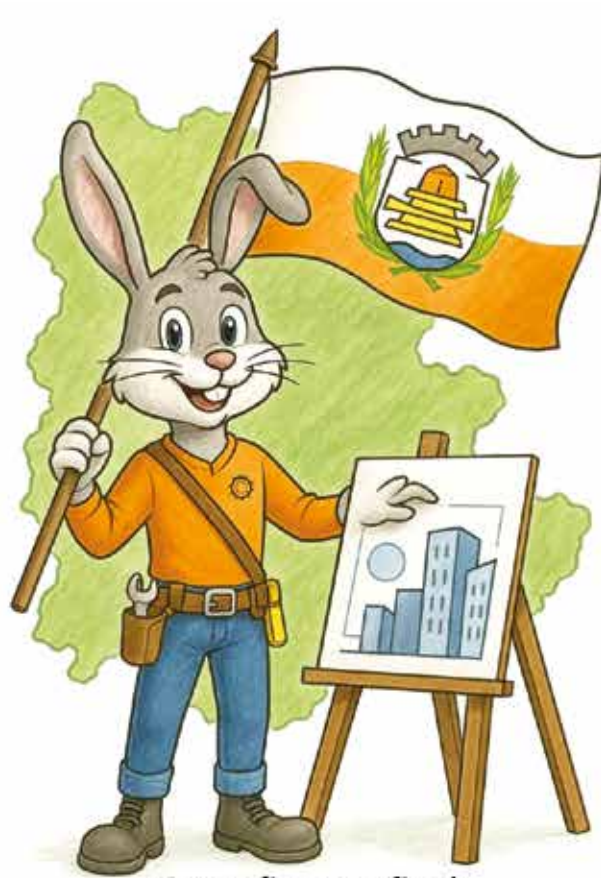
Como ficou no final o Mascote Oficial da cidade