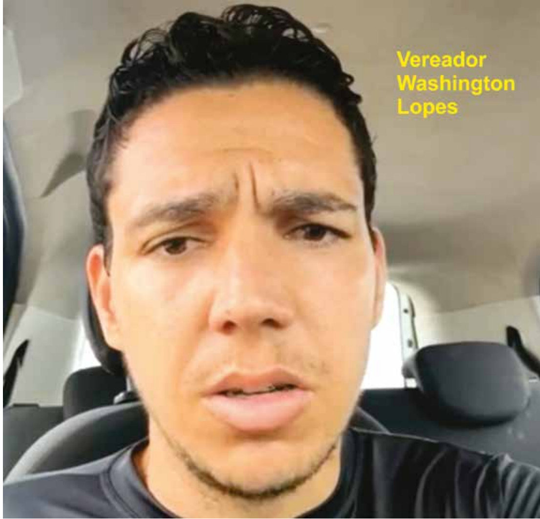
Vereador Washington Lopes

A @Rede JAPE de Comunicação está começando a fazer um trabalho de conscientização sobre as Eleições 2024 e com os políticos que estão exercendo seus respectivos cargos.