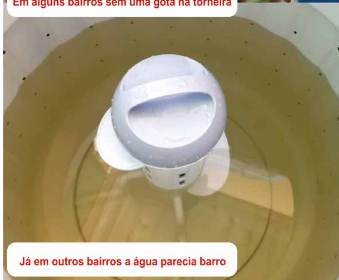
Já em outros bairros a água parecia barro

É inaugurada em Conchal a BR Óticas; verdadeiras promoções e qualidade garantida são o que tem de melhor