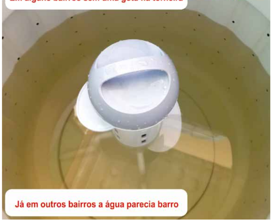
Já em outros bairros a água parecia barro

PDT de Engenheiro Coelho apoia e incentiva os futuros universitários que foram fazer a primeira etapa da prova do Enem