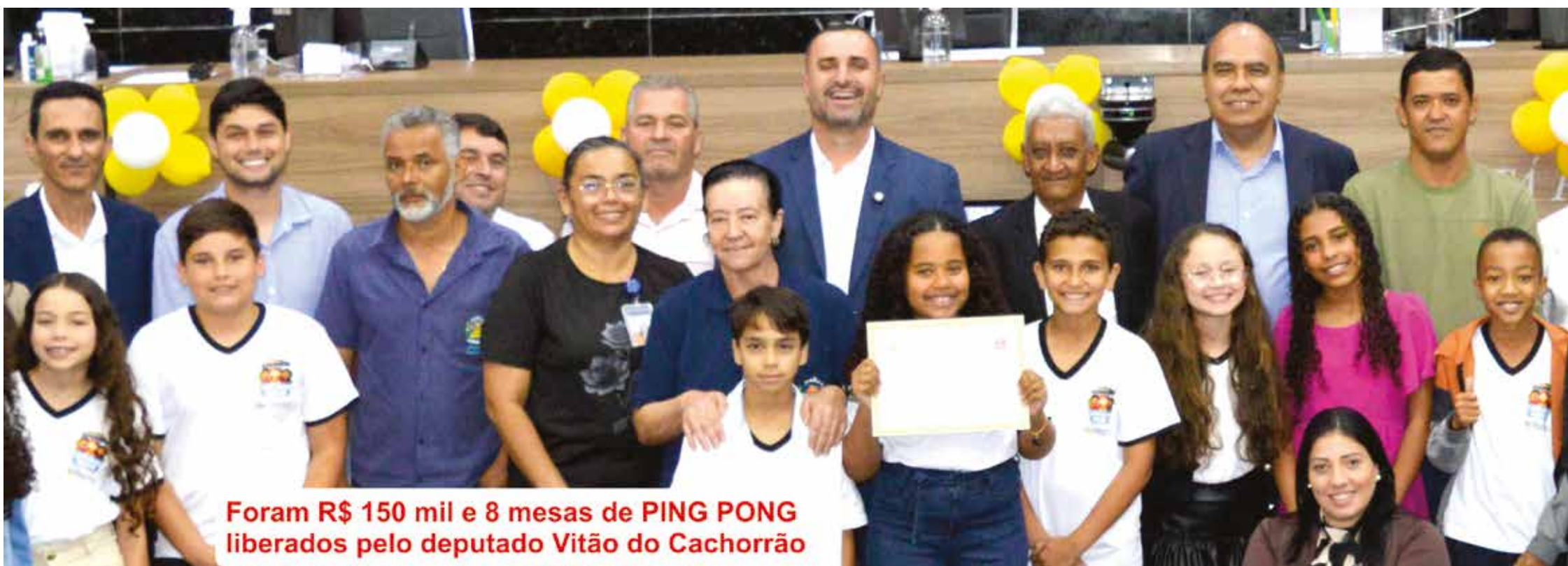
Foram R$ 150 mil e 8 mesas de PING PONG liberados pelo deputado Vitão do Cachorrão

É no Plenário da Câmara Municipal que o futuro de Engenheiro Coelho começa a ser debatido pelas novas gerações. Aconteceu na quarta-feira do dia 12 a 2ª Sessão Ordinária da Câmara Mirim, um projeto de educação cívica que tem se mostrado fundamental para o desenvolvimento da consciência política e social entre os jovens do município.