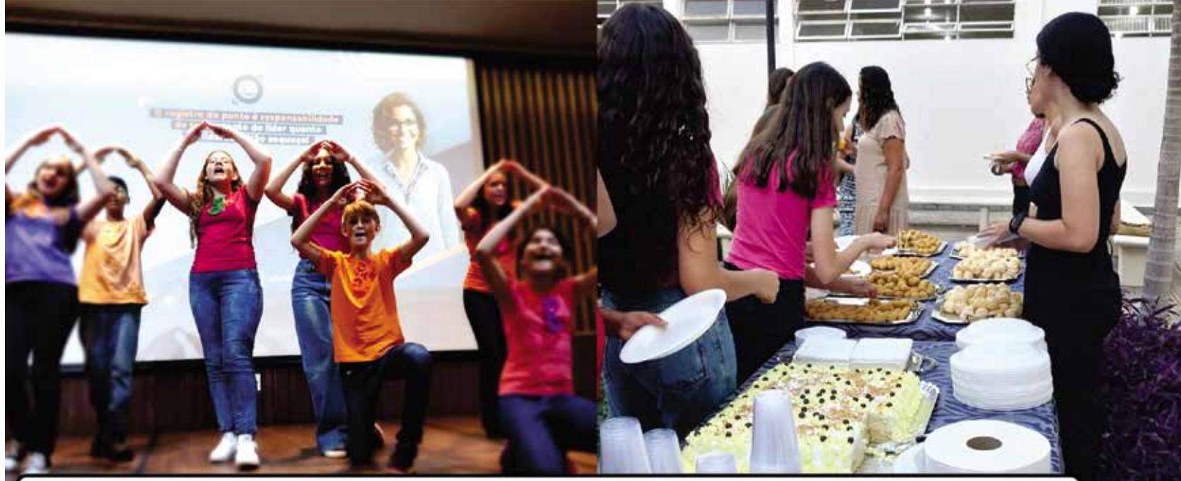
A Secretária de Educação do município deu todo apoio ao evento

Em alusão ao Dia Nacional da Alfabetização , juntamente com a comunidade coelhense, o UNASP promoveu no finalzinho da tarde do último dia 13, um evento de valorização dos professores das escolas do município de Engenheiro Coelho, especialmente os que trabalham com alfabetização.