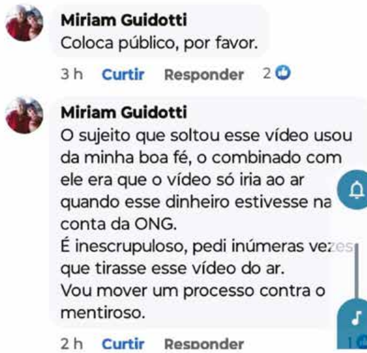
Indignada, Presidente da ONG o chamou de inescrupuloso