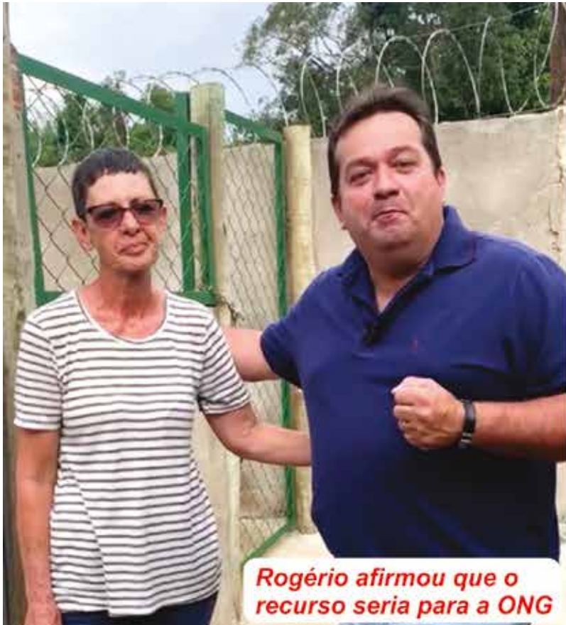
Rogério afirmou que o recurso seria para a ONG