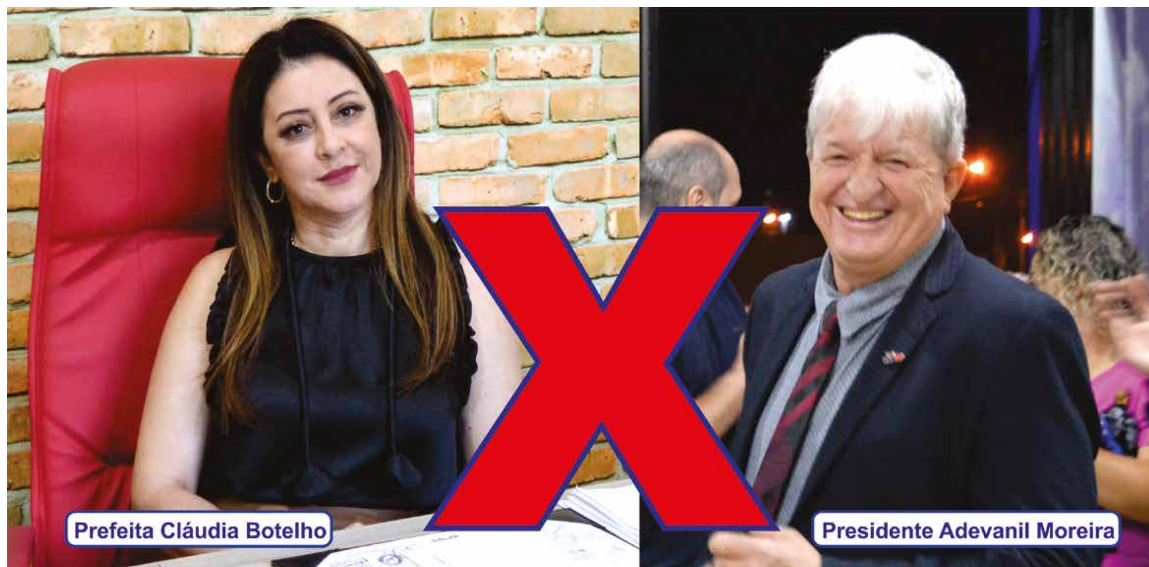
Prefeita Cláudia Botelho