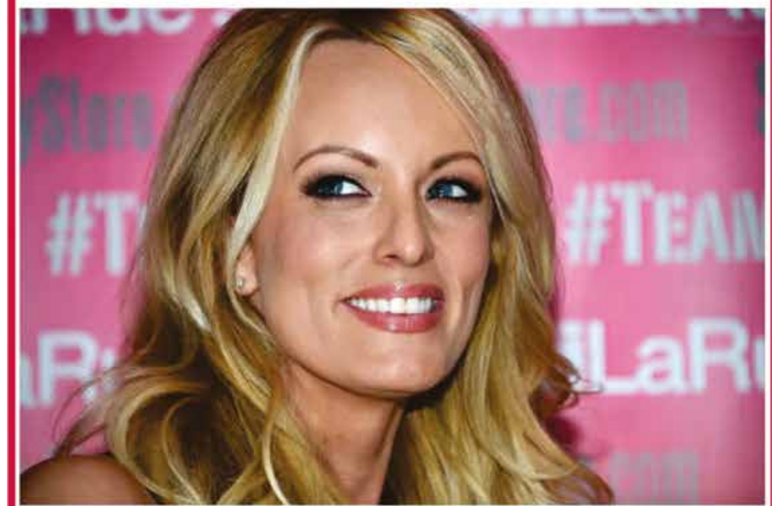
Stormy Daniels em evento na Califórnia em 2018

maio de 2024, no tribunal de Fort Pierce, na Flórida.