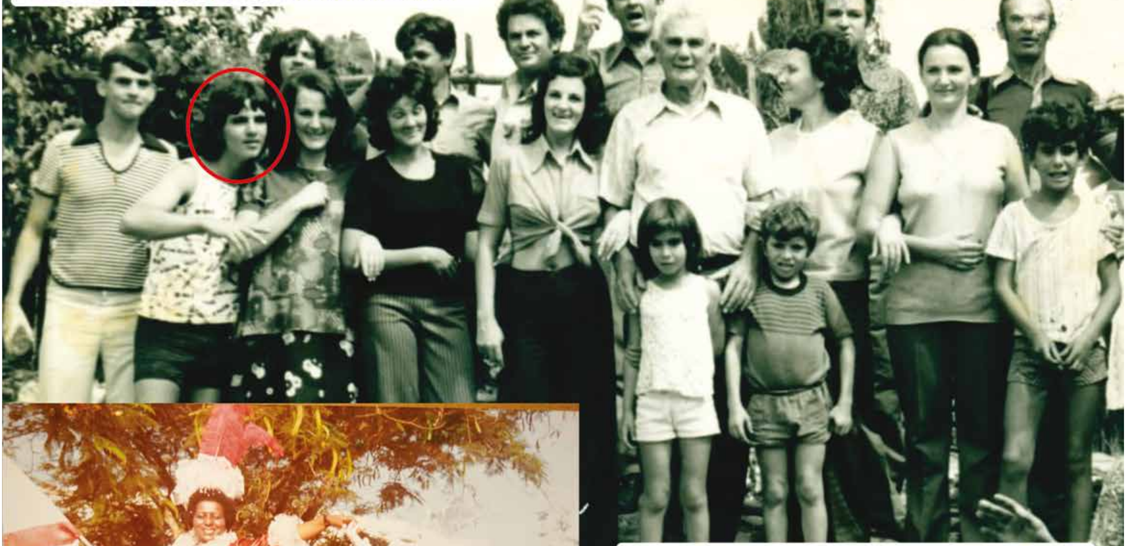
O pai do Pedrinho fazia questão de reunir a família no Final de Ano e na Páscoa, e a foto era de praxe