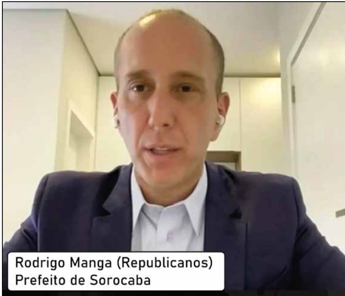
Rodrigo Manga (Republicanos) Prefeito de Sorocaba

O prefeito de Sorocaba, Rodrigo Manga (Republicanos), foi afastado do cargo ontem (06), por decisão da Justiça após pedido da Polícia Federal. Ele é um dos alvos da segunda fase da OPERAÇÃO COPIA E COLA , que apura irregularidades em contratos de saúde pública em São Paulo.