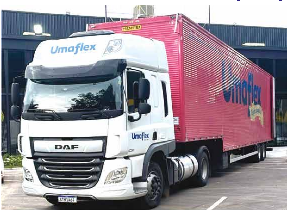
Carreta da UMAFLEX carregada de colchões leva auxílio às vítimas da tragédia em Ubá (MG)