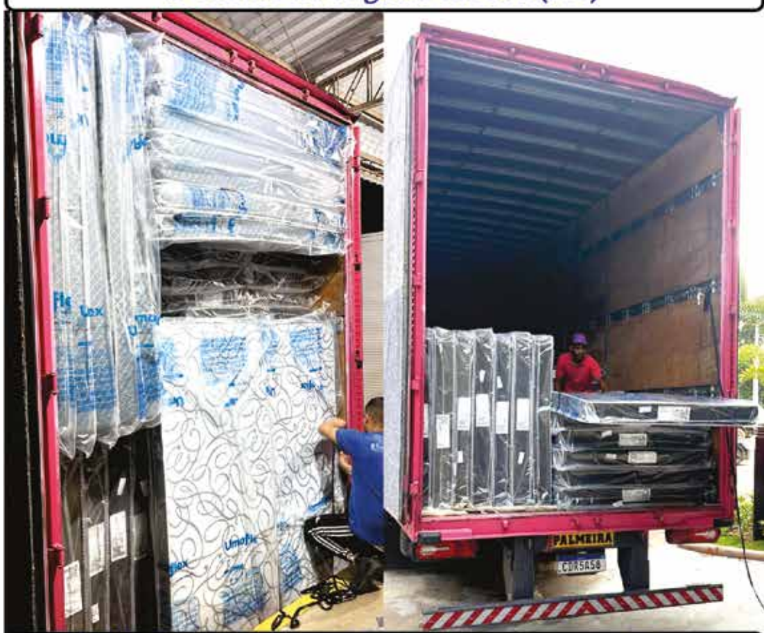
‘A distribuição dos colchões permite que os abrigos temporários ofereçam melhores condições de acolhimento’

Em um cenário marcado pela urgência e pela necessidade de reconstrução, a solidariedade cruzou divisas estaduais para levar conforto a quem perdeu quase tudo. A empresa Umaflex, sediada em Conchal (SP), protagonizou um importante gesto de responsabilidade social ao enviar uma carreta carregada de colchões para o município de Ubá, em Minas Gerais.