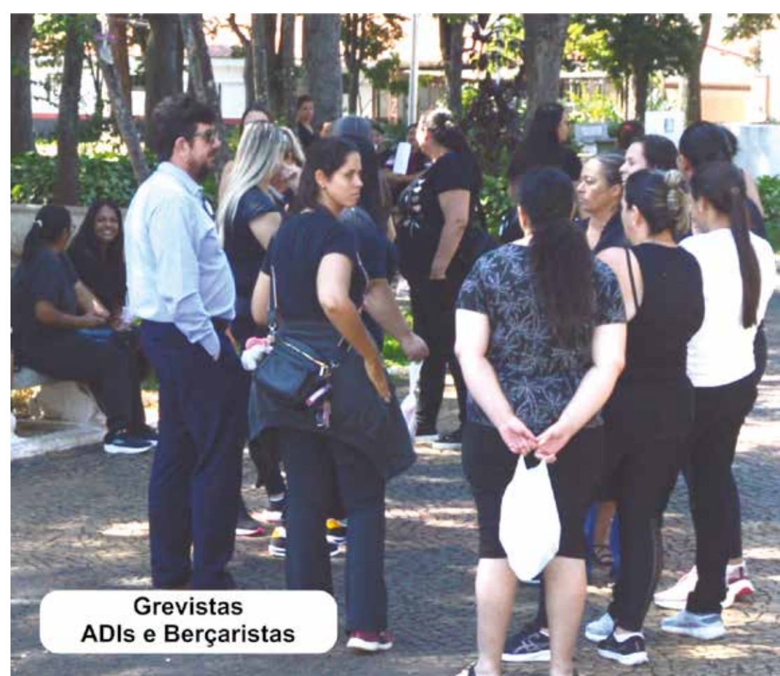
Grevistas ADIs e Berçaristas