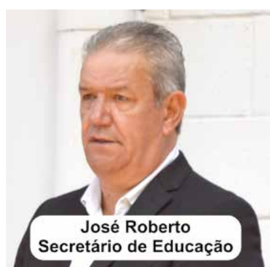
José Roberto Secretário de Educação

A greve que as ADIs e berçaristas iniciaram na segunda-feira do dia 30, tendo no comando o SINDICON (Sindicato dos Servidores Públicos de Conchal) , e que terminou no dia seguinte (31), logo depois de decisão do Tribunal de Justiça de São Paulo onde 70% das grevistas deveriam voltar ao trabalho, 100% decidiram