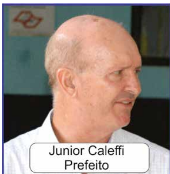
Junior Caleffi Prefeito