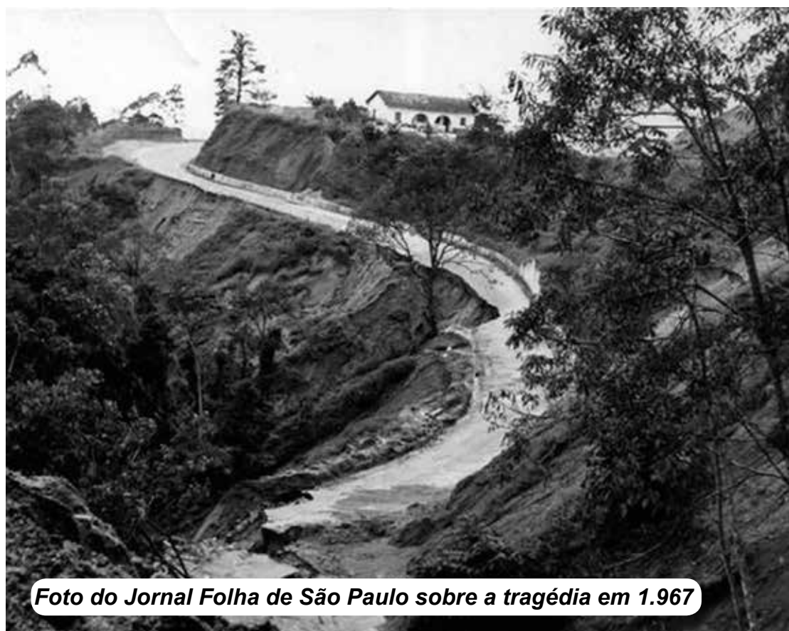
Foto do Jornal Folha de São Paulo sobre a tragédia em 1.967