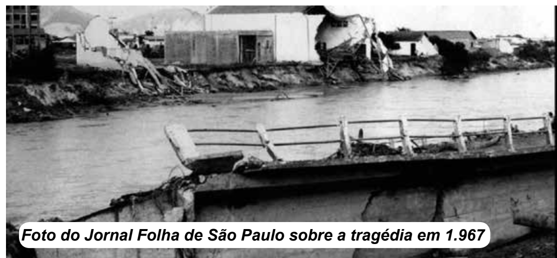
Foto do Jornal Folha de São Paulo sobre a tragédia em 1.967