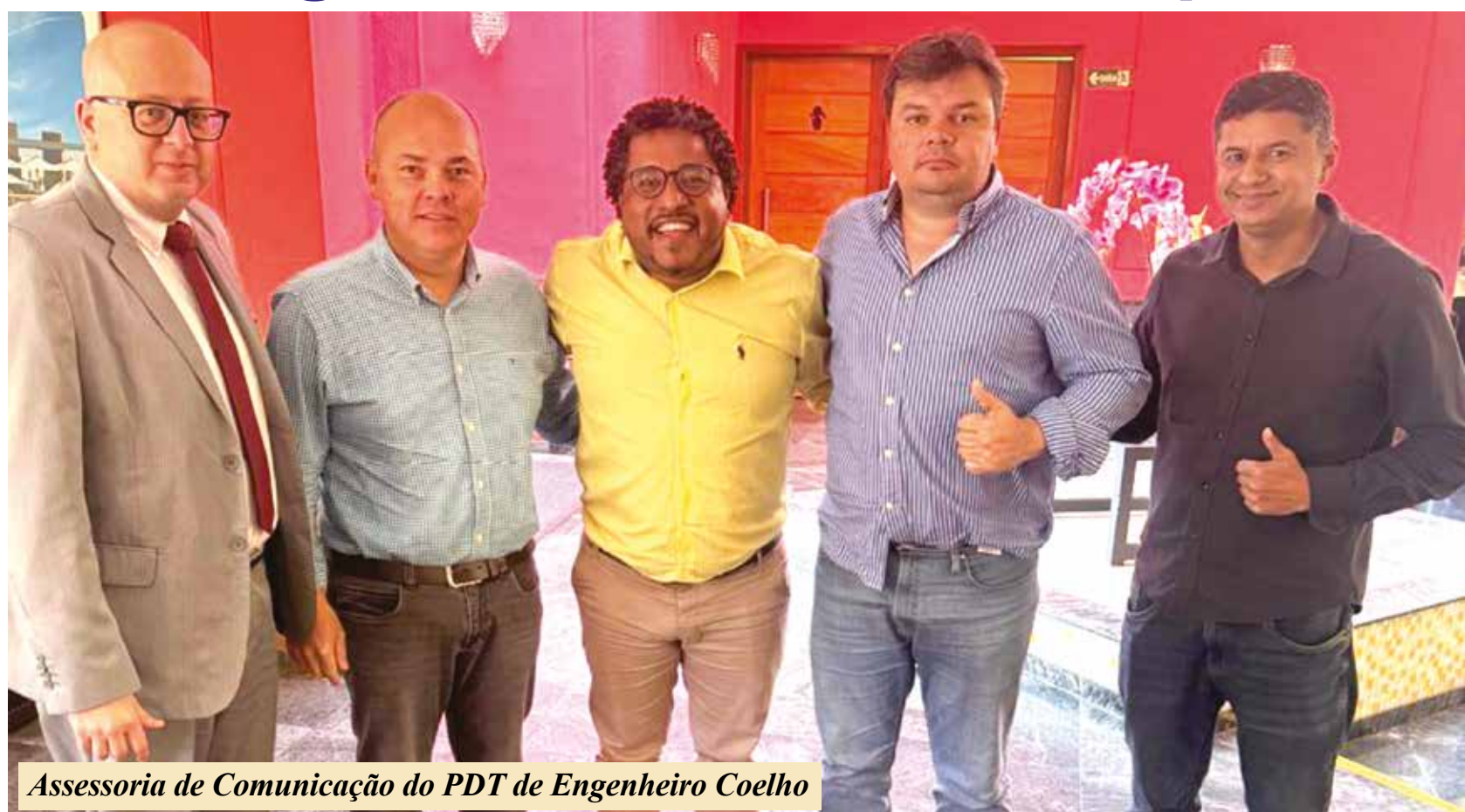
Assessoria de Comunicação do PDT de Engenheiro Coelho