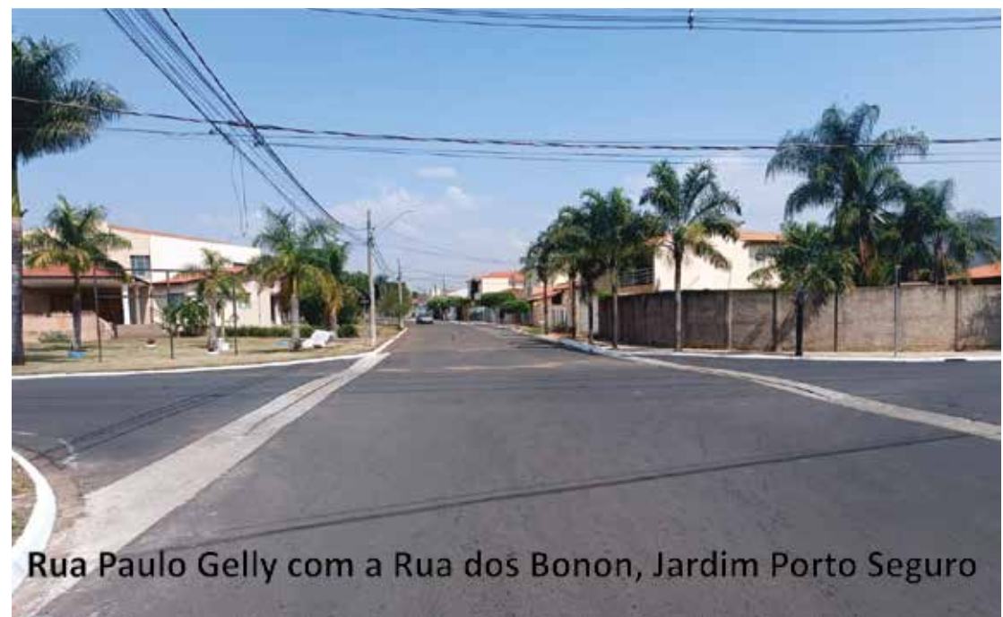
Rua Paulo Gelly com a Rua dos Bonon, Jardim Porto Seguro